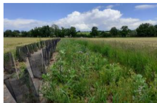
Bande enherbée entre des parcelles sur la plateforme de Valeins