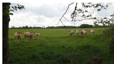
Pâturage en Dombes