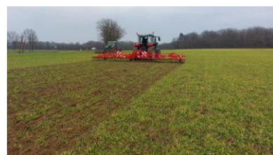
Démonstration de désherbage mécanique

En contactant l'animatrice pour faire établir un diagnostic initial de l'exploitation. La contractualisation se fait au « fil de l'eau », jusqu'à fin 2024