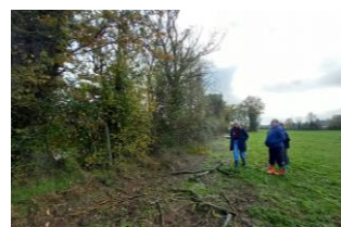
Marquage de coupe d'une haie vieillissante reprise au pied