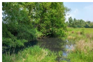
Exemple de mare pouvant être restauré