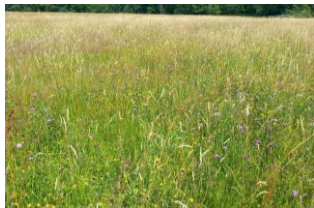
Prairie fleurie en Dombes